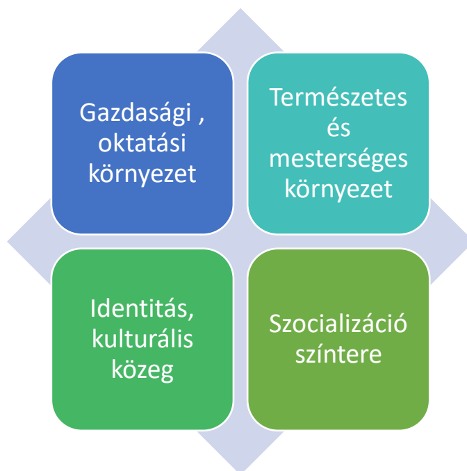
4. ábra Keszthely, mint mikrokörnyezet hatása iskolánkra

Négy területet, hatást határoztam meg: gazdasági környezet, természetes és mesterséges környezet, identitás és kulturális közeg, szocializációs színtér.