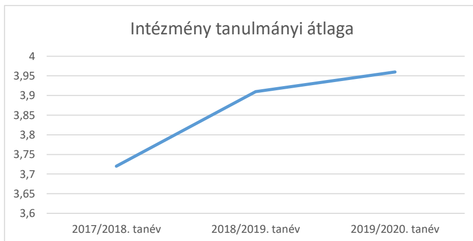
1. számú ábra

Továbbra is magas az intézmény tanulmányi átlaga. Ezt mutatják az iskolai Kréta rendszerből letöltött oszlopdiagramok (2. és 3. számú ábra) is.